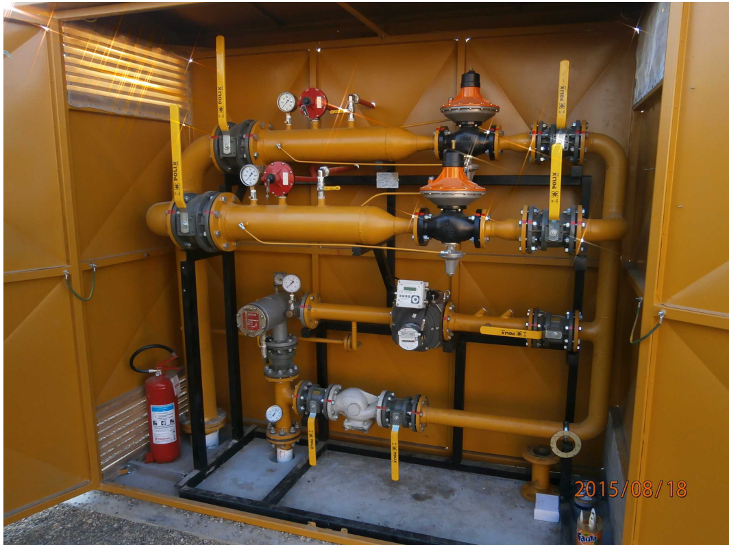
ULJARICE BAČKA doo - Sušara žitarica Senta Merno-regulaciona stanica za prirodni gas – 1.000 m 3 /h