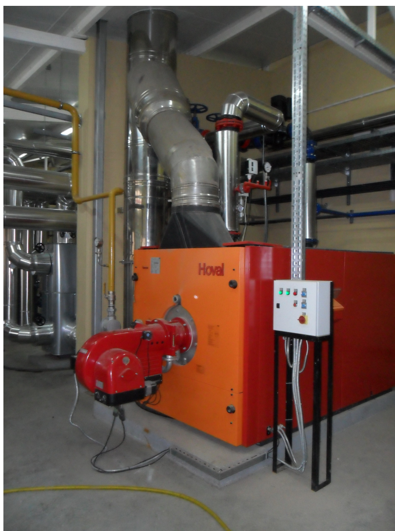
ALLTECH FERMIN - Senta Postrojenje za preradu otpanih voda – Kotlarnica