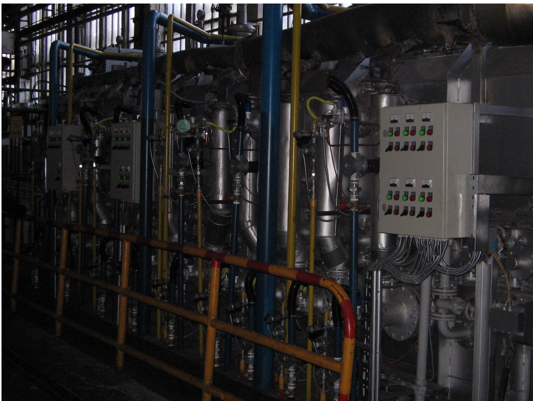
Valjaonica bakra Sevojno Gorionička instalacija na peći za svetlo žarenje