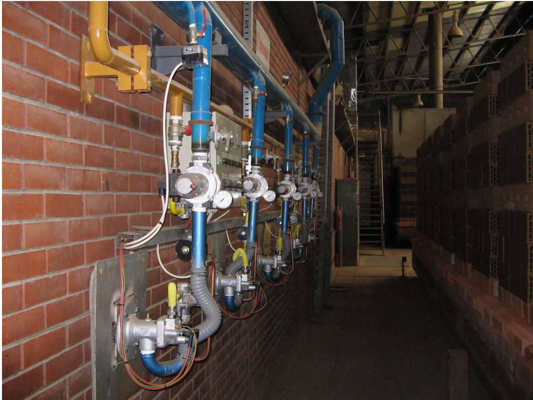
IGM UNIVERZUM KUBRŠNICA - Arandjelovac Gorionička instalacija na tunelskoj peći