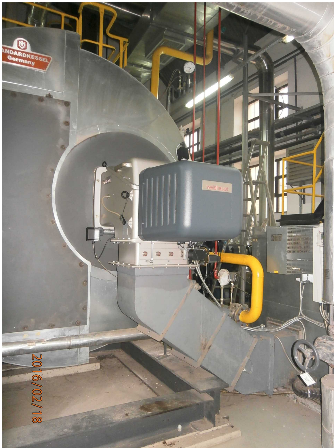
Philip Morris Operations a.d. Niš Ugradnja gorionika "WEISHAAPT" tip: WKG 70/3-A 3LN multiflam

– Redovni servis i održavanje gorionika, gorioničkih i kotlovskih instalacija u preko 30 osnovnih i srednjih škola u Srbiji.