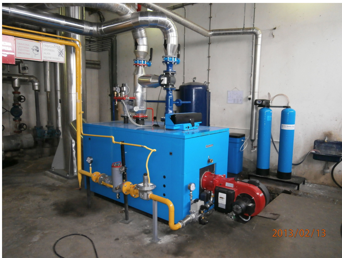
NIS a.d., Novi Sad Rekonstrukcija gasne kotlarnice