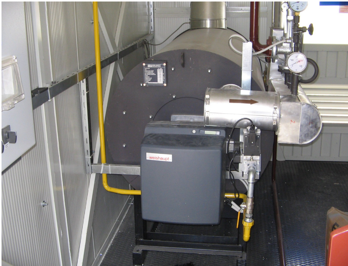
LAFARGE - Beočin Termouljna kotlarnica