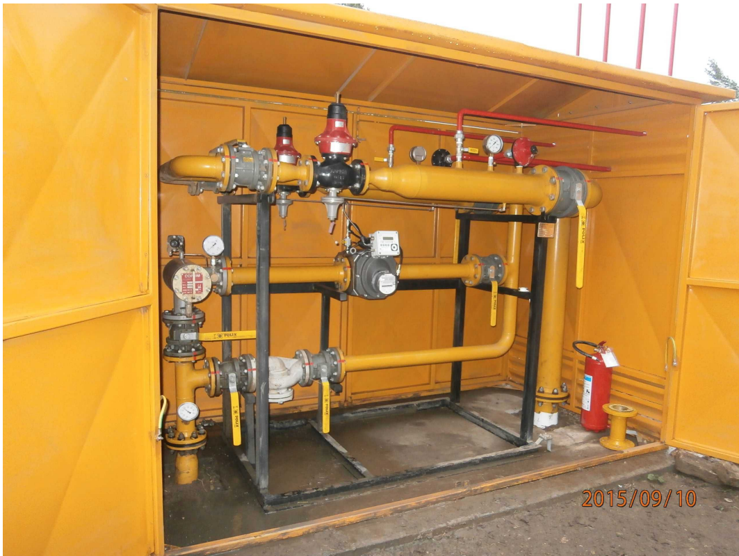
DIJAMANT AD - Sušara žitarica Odžaci Merno-regulaciona stanica za prirodni gas - 1.600 m 3 /h