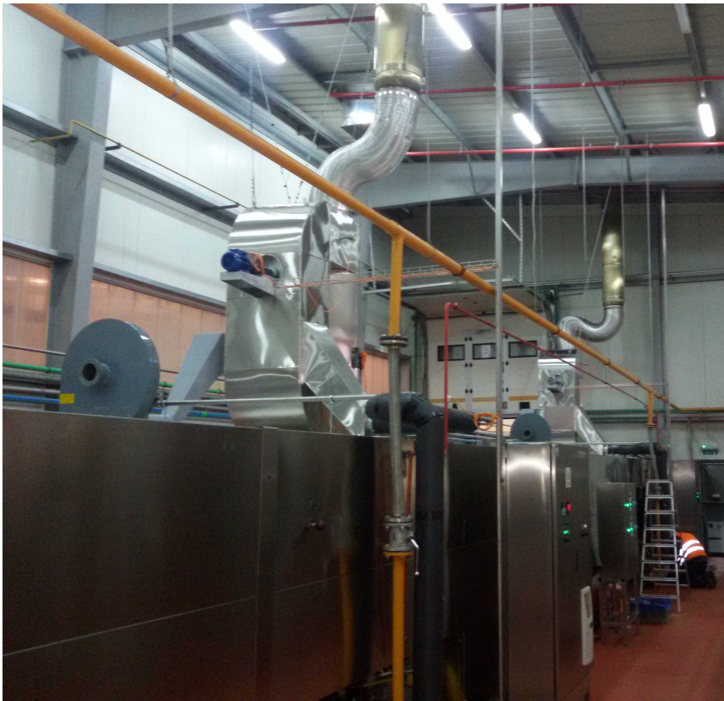
MARBO-PRODUCT doo - proizvodni pogon Maglič Rekuperatori dimnih gasova na proizvodnoj liniji