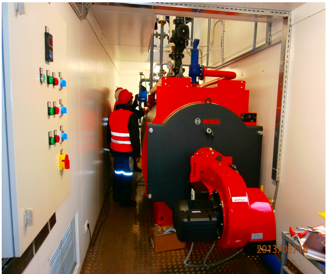
NIS a.d. Novi Sad Kontejnerska gasna kotlarnica 2.500 kW