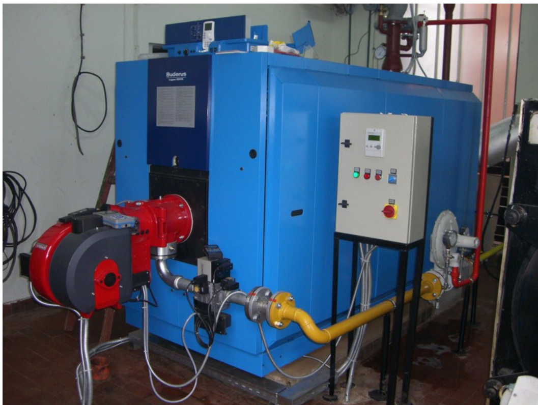
TO NOVI SAD - Toplana DUDARA – Sremski Karlovci