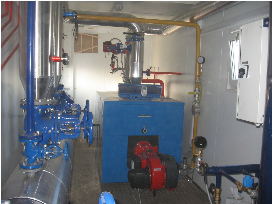
NIS a.d. Novi Sad Kontejnerska gasna kotlarnica 700 kW